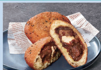
【札幌】ブルマンベーカリー／道産牛のビーフ&チーズカレーパン