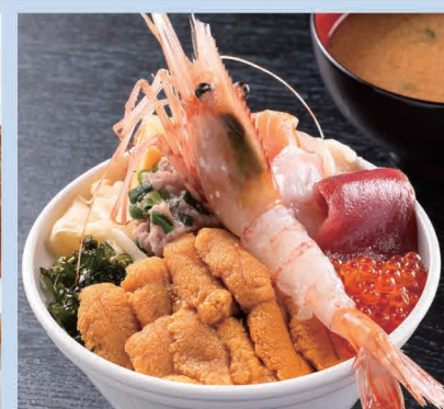
【余市】うに専門店 世老屋／世老屋海鮮丼