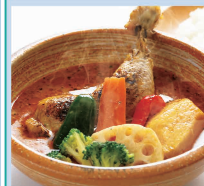
【札幌】ピストロ南家／チキンベジタブルスープカレー