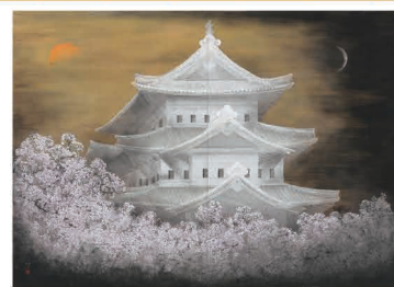
那波多目 功一《日月の桜城》