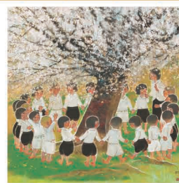
村上 裕二《先生といっしょに》