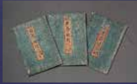
鳥山石燕「画図百鬼夜行」1776年 水木しげる蔵